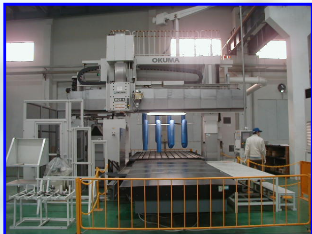
大型門型 5面5軸加工機 OKUMA