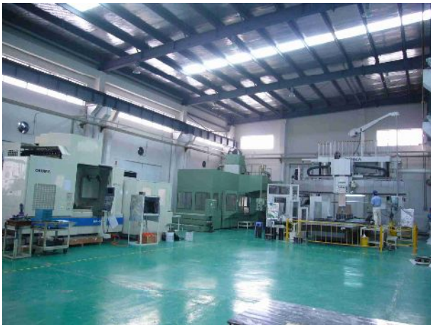
大型門型 5面5軸加工機