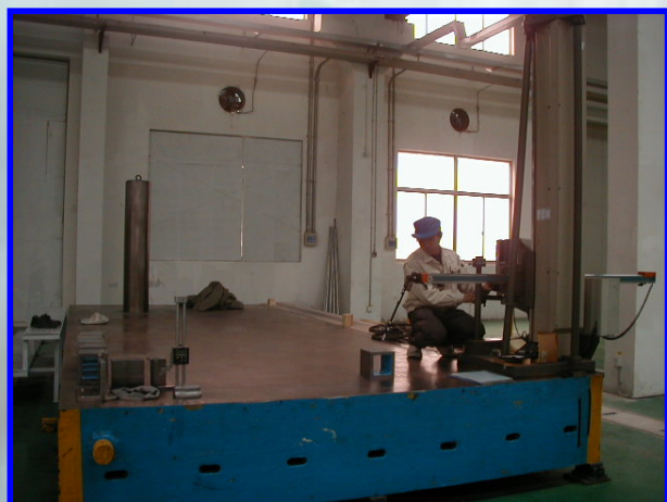
大型検査定盤 3次元測定器 東京貿易

工場は2800㎡の広さを持ち、 大型5面5軸マシニングセンター 2台 中型のマシニングセンター 1台、 各種の汎用設備一式、 大規模の検査定盤 1台、 東京貿易 3次元測定器 1台、 小型3次元測定器1台、 FARO 3次元測定器1台